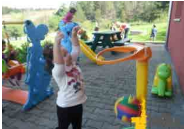
Lojëra shoqërore në natyrë me rekuizita sportive