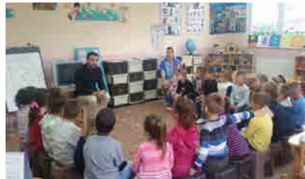
Shfaqje – cirku me qen