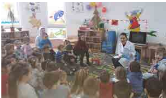
Bashkëbisedimi me gjyshen

Java tjetër e bashkëpunimit me familjen vazhdoi me shumë vizita të tjera që na u bënë nga mysafirë të ndryshëm, si prindër, gjyshër dhe pjesëtarë tjerë të familjeve të fëmijëve.