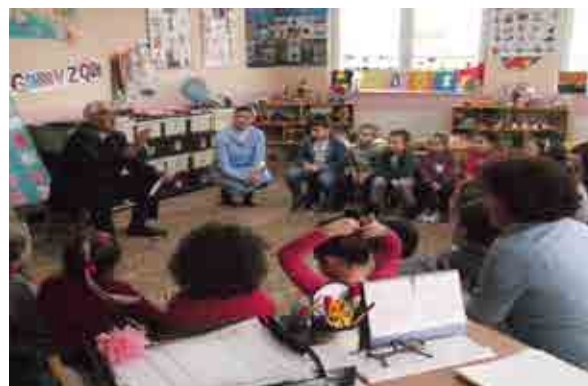
Gjyshi shkrimtar në dhomë