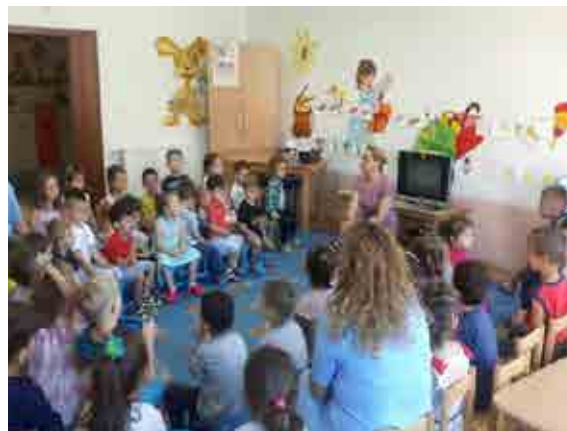
Nëna me profesionin e mësueses së gjuhës angleze Babi me profesionin e postierit në dhomë