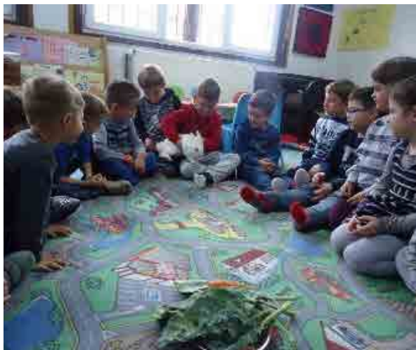
Takimi i mëngjesit, njohja me lepurin dhe ushqimin e tij

Pas kësaj faze së bashku me disa nga prindërit realizuam një vizitë jashtë kopshtit, në Qendrën për Strehimin e Kafshëve Endacake në Harilaq.