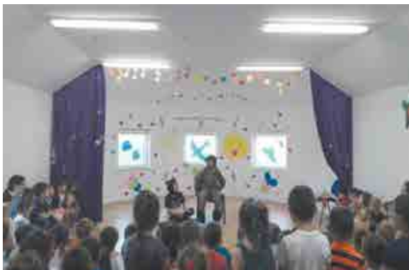
Babi me profesionin e policit në klasë