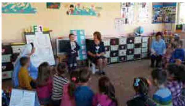
Nëna me profesionin infermiere