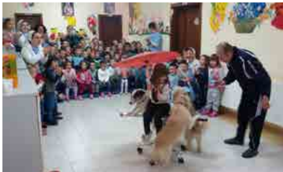
Babi që na rrëfeu për festën e Bajramit