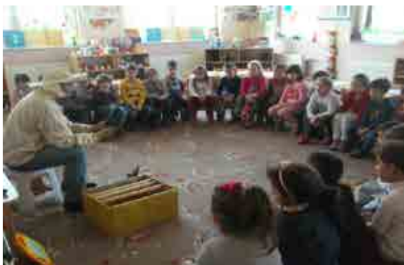
Babi me profesionin e bletarit në dhomë