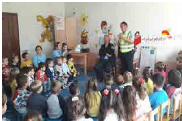
Daja në kopsht me shfaqje teatrale