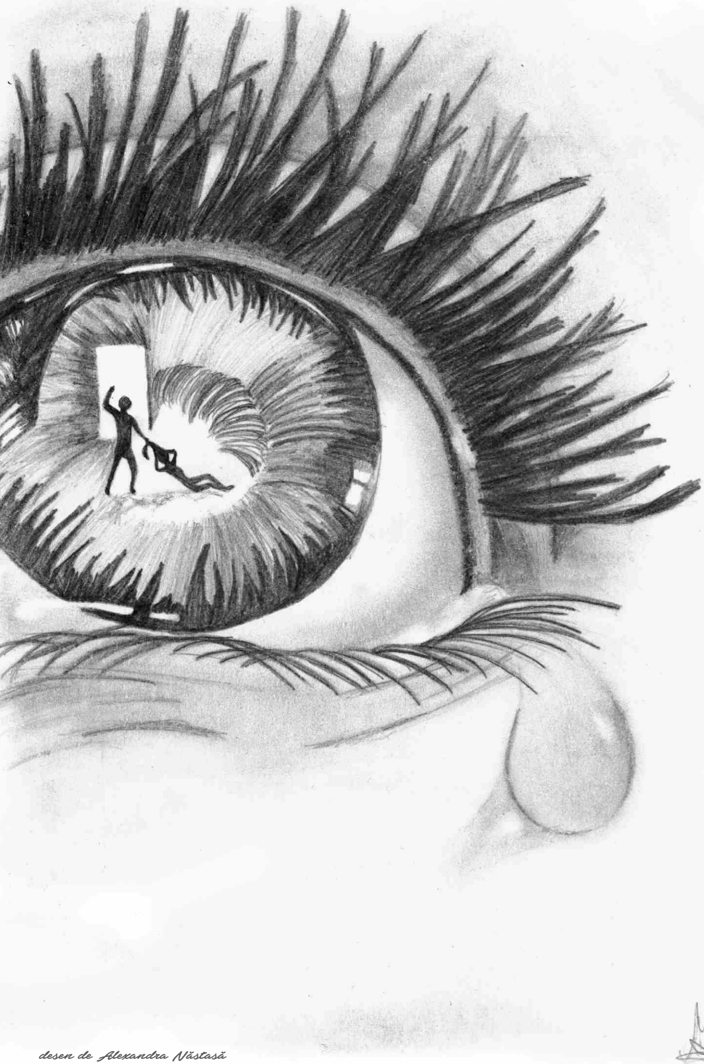
desen de Alexandra Năstasă

În perioada aprilie - iulie 2017, în contextul campaniei globale „It takes a World to End Violence Against Children”, noi, un grup de 14 copii din orașul Negrești, județul Vaslui, voluntari ai Fundației World Vision România și membri ai grupului TiN, am desfășurat o cercetare la nivelul orașului Negrești pentru a identifica impactul pe care îl are mediatizarea violenței (prin intermediul diferitelor programe de televiziune, dar și a informațiilor și imaginilor care circulă în mediul online) asupra dezvoltării copiilor și tinerilor.